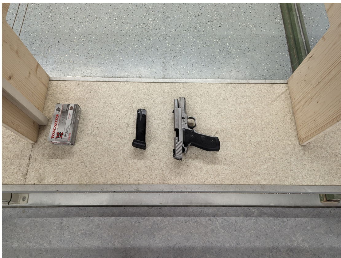
Korrekte Ablage der Handfeuerwaffe mit freiem Blick ins Patronenlager und leerem Magazin