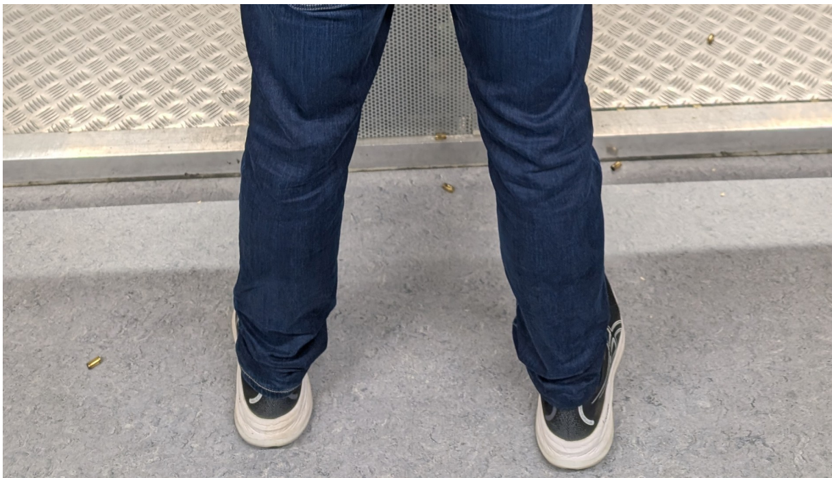
Schulterbreiter Stand, der rechte Fuß ist bei Rechtshändern leicht nach hinten versetzt.

Ist die Waffe im Anschlag bildet die Kimme mit den beiden Schultern etwa ein gleichschenkliges Dreieck (von oben betrachtet).