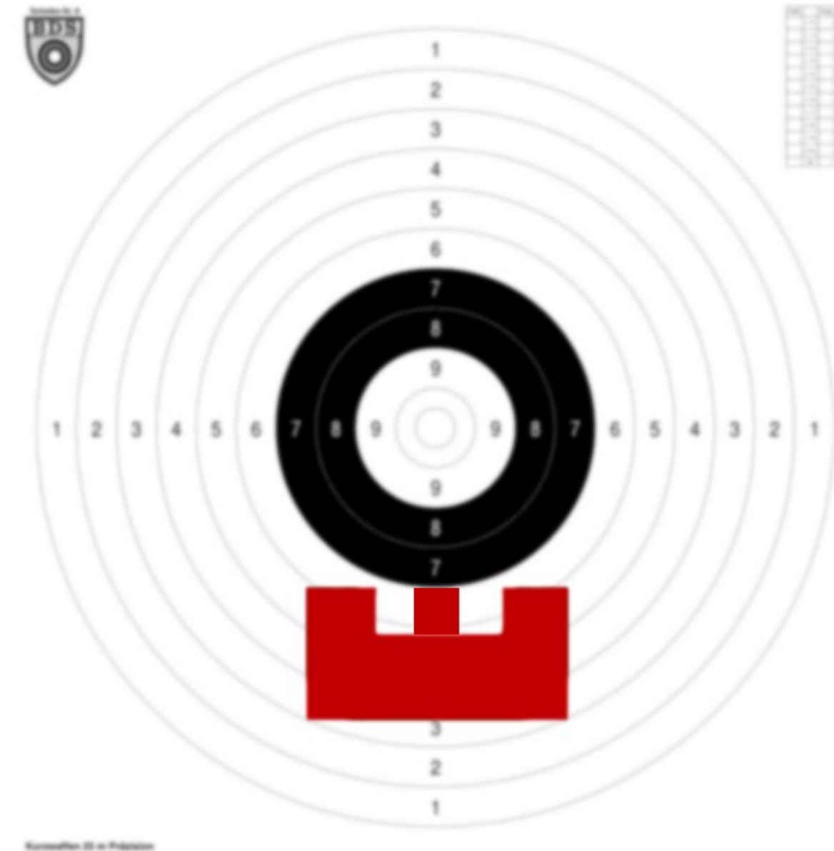
Zielen auf „Spiegel aufsitzend“