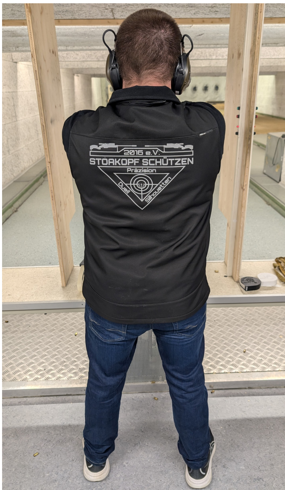
Ein sicherer Stand