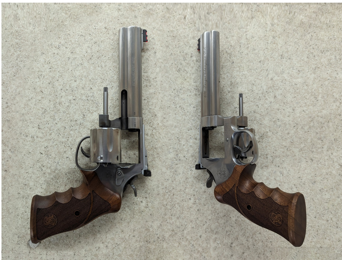
Revolver können auf eine der beiden Arten abgelegt werden.