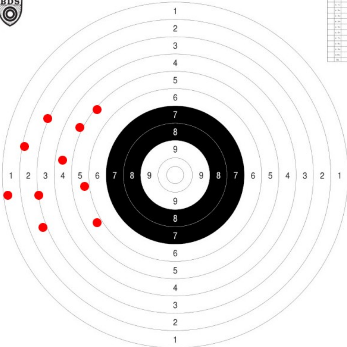
Kurzweaffen 25 m Präzision