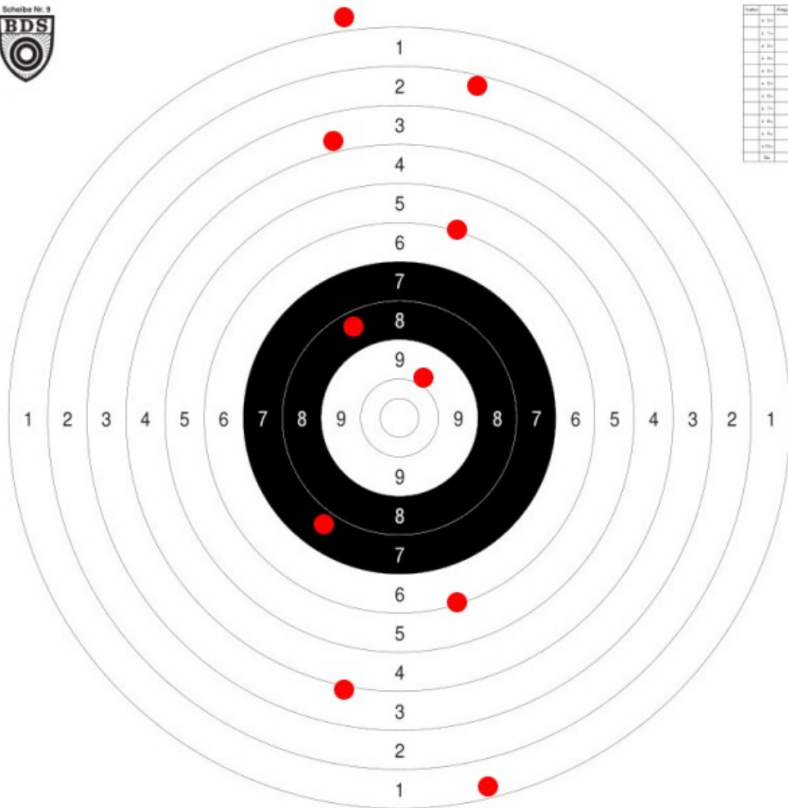
Kurzwaffen 25 m Präzision