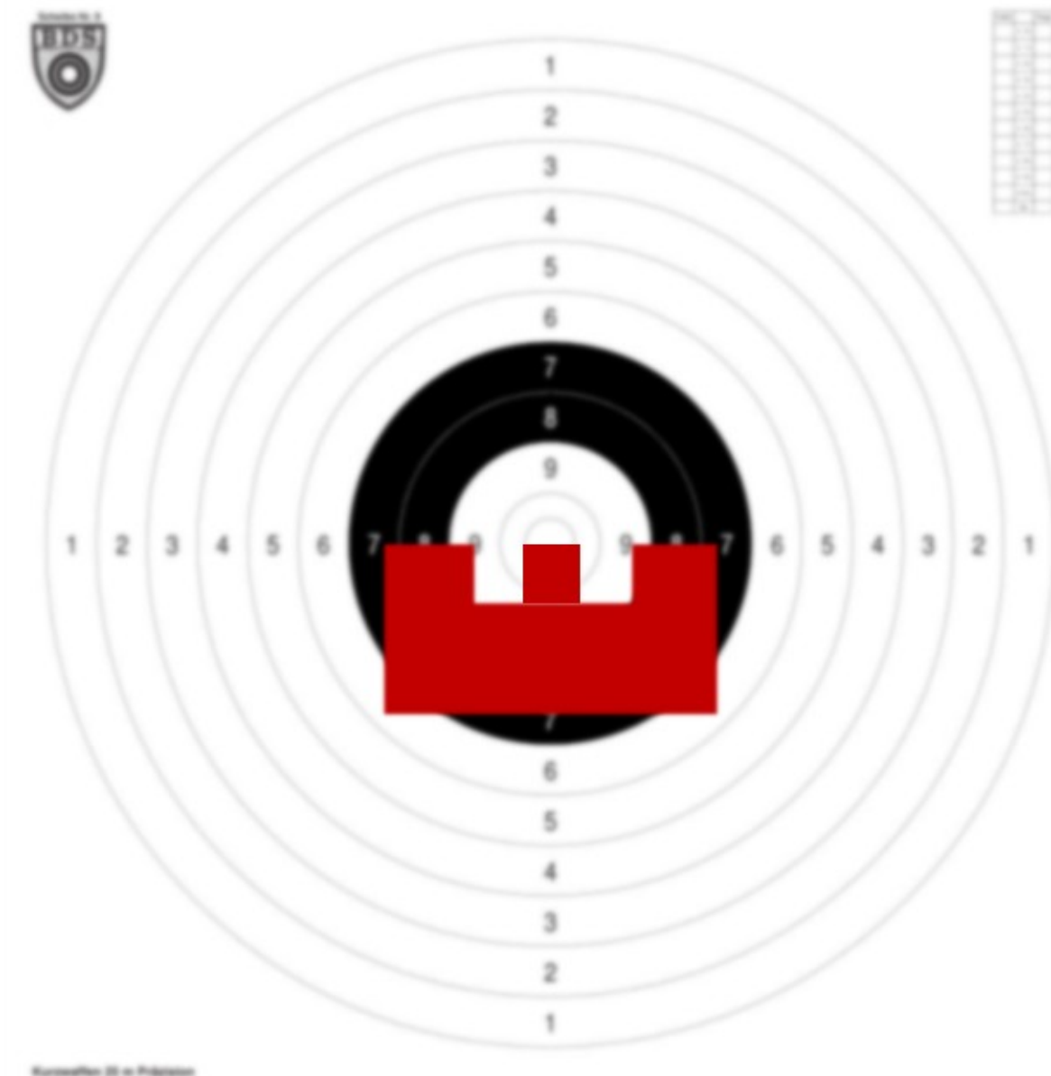
Zielen auf „Fleck“

Sportpistolen (hauptsächlich im Kaliber 22lfB) sind oft „Spiegel aufsitzend“ eingeschossen. Dies bedeutet, dass man nicht in die Mitte der Scheibe, sondern auf den unteren schwarzen Rand, also unterhalb der Sieben zielt.